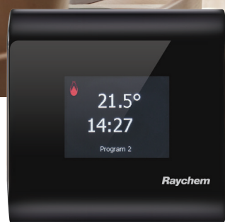
Czarny front nVent RAYCHEM