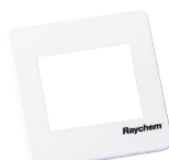
Biały front RAL 9010