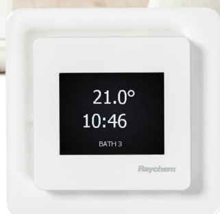
Biały front RAL 9003